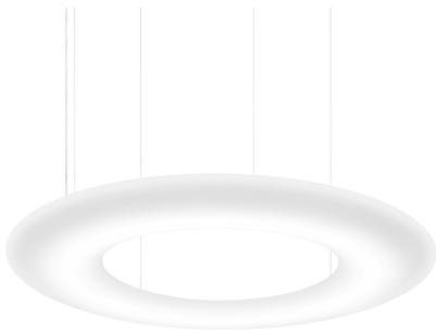
RIPPVALGUSTI TREPIHALLIS, TÄHIS JOONISEL V1A

KUNSTITEOS ASUB KOHTUMAJA AVALIKUS 1 JA 2. KORRUSE VAHELISE TREPIKOJA SEINAL. TEOS ON VAADELDAV NII 1 KUI KA 2 KORRUSELT KÕIGILE LIIKUJATELE. TEOS KINNITATAKSE SEINALE, SEE VÕIB OLLA NII KAHE KUI KOLMEMÕÖTELINE TEOS. TEOSE ERALDI VALGUSTAMISEKS ON VALITUD SEINAVÄLGUSTI TÄHIS JOONISEL V22, MILLE VÕIB KA ÄRA JÄTTA KUI SEE EI OLE TÄIESELE VAJALIK. JOONISELE ON MARKEERITUD TEOSE MAX VÕIMALIK ALA. TEOS PEAB OLEMA TÄPSELT NII SUUR ET SEE OLEKS VAADELDAV NII ESIMESEL KUI KA TEISEL KORRUSEL LIIKUJALE JA MITTE AINULT TREPIK. TEOS PEAB ARVESTAMA HOONE AJALOOSE TAUSTAGA, LÄHTUMA ASUTUSE VÄÄRIKUSEST NING ARVESTAMA HOONE VIIMISTLUSMATERJALIDE VALIKUTE NING TOONIDEGA MOODUSTADES NII TERVIKU NING LISADES RUUMI LUKSUSLIKKUST NING SÄRA. TREPIHALL KUHJ TAIES ON PLANEERITUD ON VÄRVIKUD NATURAALSETES HELEDATES TOONIDES, TÄHIS JOONISEL V-01- TOON H497 (TIKKURILA). OLEMASOLEV PÄEKIVITREPP SÄILITATAKSE, PUHASTATAKSE NING IMMUTATAKSE HÜDROFOOBSE NANOPREPARAAT LUBJAKIVI JA TRAVERTIINI (NT TOPMEISTER STEIN) MIS KAITSEB ASTMEID MUSTUSE EEST JA MUUDAB PINNA LIHTSAMINI PUHASTATAVAKS. TREPI METALLIST PIIRE SÄILITATAKSE, VÄRVITAKSE NAT VALGEKS JA PUIDUST KÄSIPUUVÄRVITAKSE AKTSENTTOONI HALLIKS, TOON M499 (TIKKURILA). KUI HOONE VÄRVIGAMMA ON LOODUSLIK VALGE, PÄEKIVIHALL, NATURAALNE TAMME PUIT JA KULDNE, SIIS TÄIESE VÄRVIGAMMA, VIIMISTLUS PEAB NENDE TOONIDEGA ARVESTAMA NING NEID KAS TÄIENDAMA VÕI LISAMA AKTSENTI.